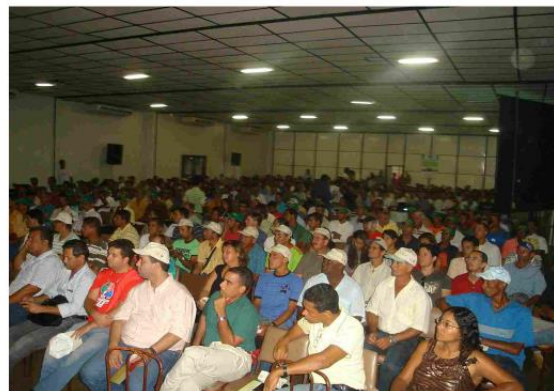
SEMINÁRIO LEITE OESTE – PROGRAMA BALDE CHEIO Abril de 2009