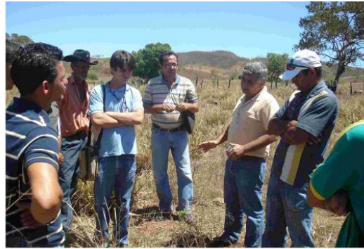
Implementation of Full Bucket in western Bahia