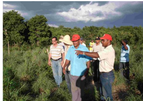
Field days cycle - Angical