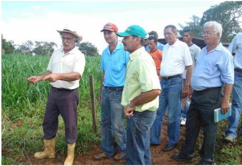
Technical trips to other states to visit demonstrative units where full bucket were implemented