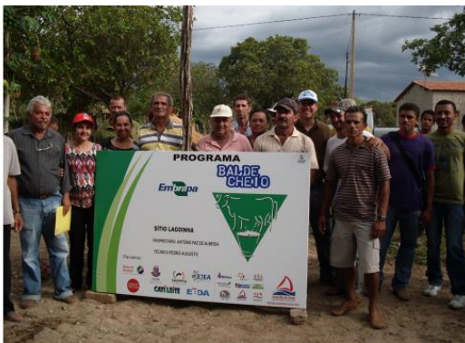
Field days cycle – St. Rita de Cassia