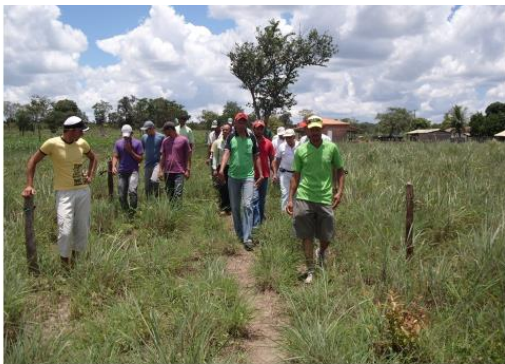
Field days cycle - Baianopolis